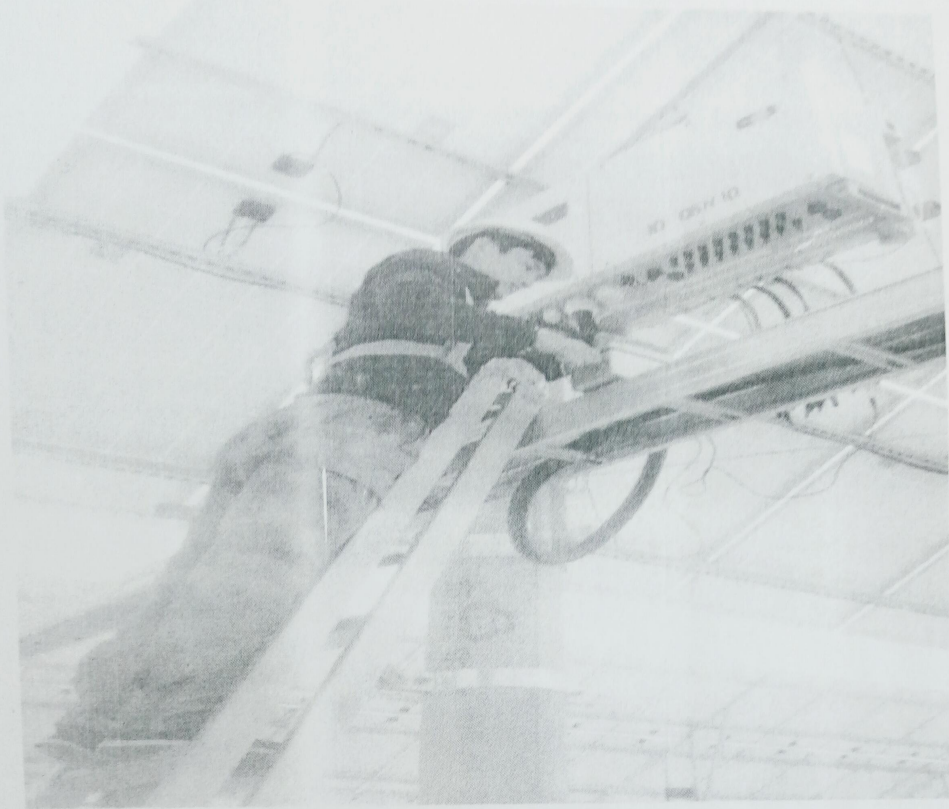
1、对逆变器接线进行检查