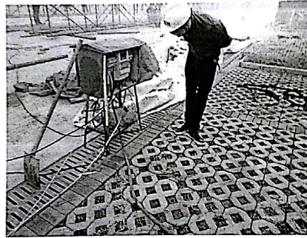
临时用电规范不规范、电线、电缆乱拉乱扯

注 本表一式__份，由监理项目部填写，业主项目部、施工项目部各存一份，监理项目部存_1_份。