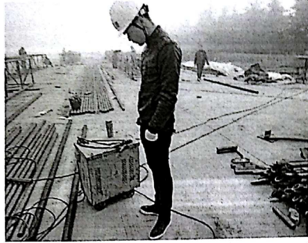
电焊机无接地、无合格证