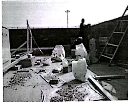
屋面材料堆放不整齐