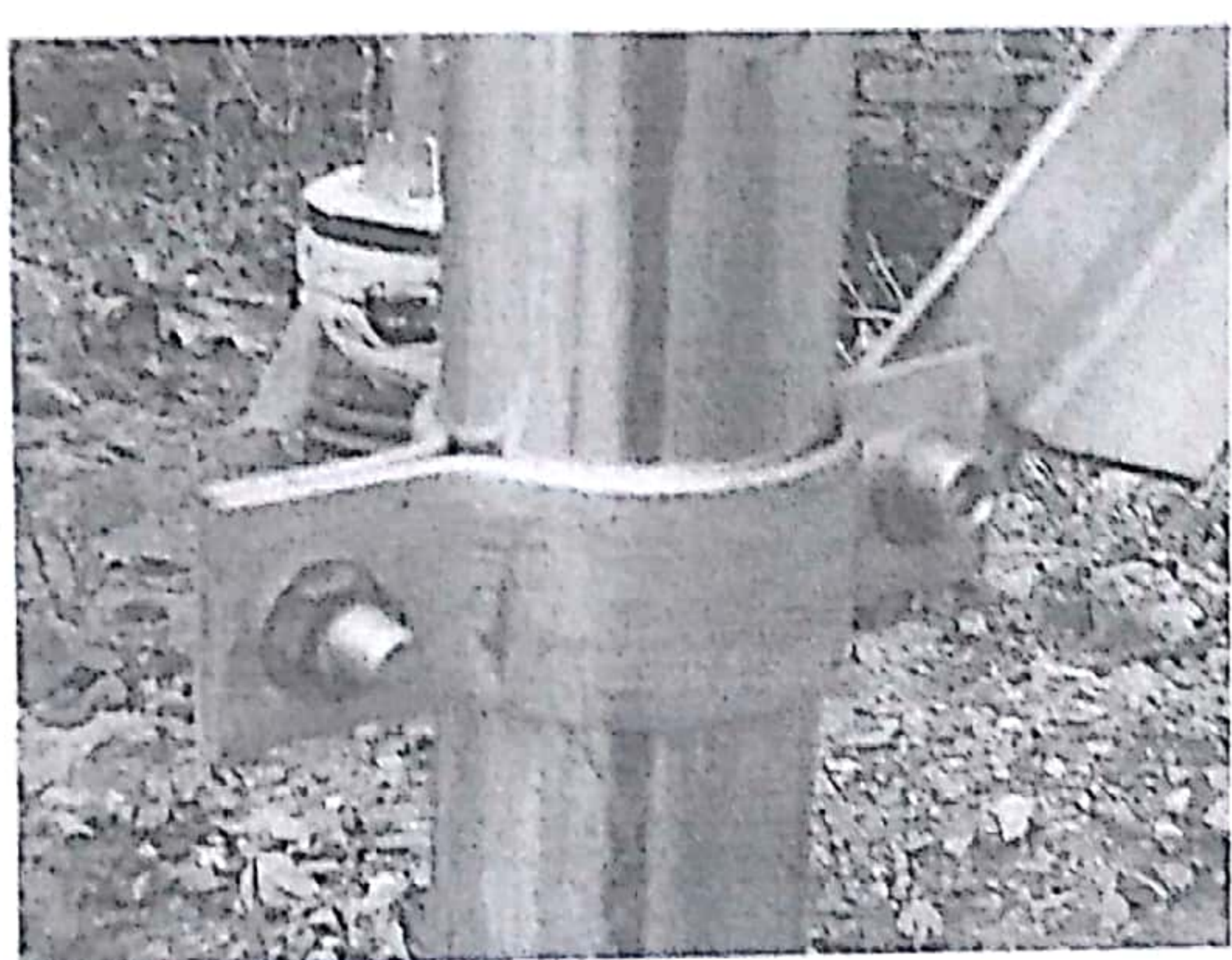
部分螺丝和斜撑杆件生锈