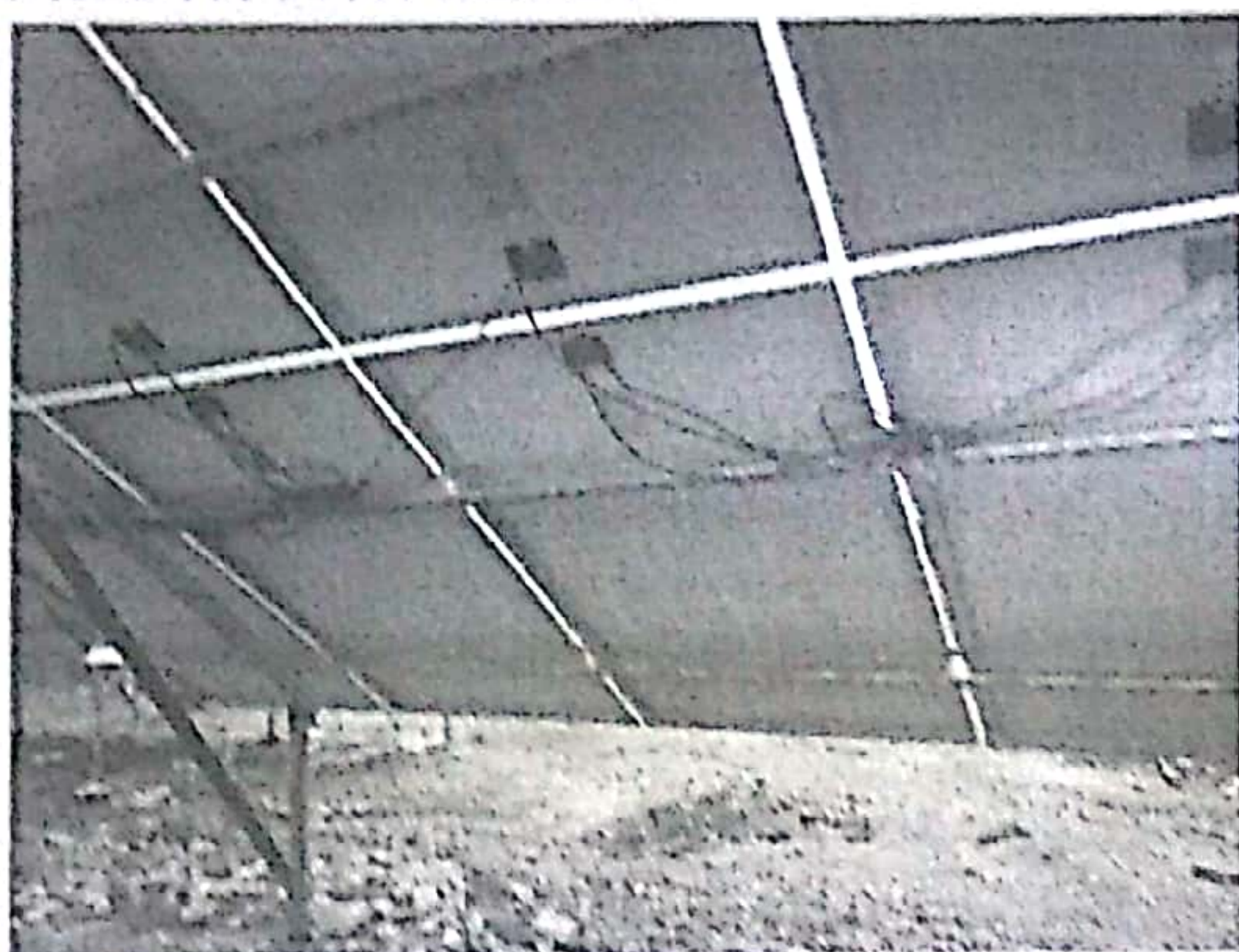
部分组件汇线凌乱