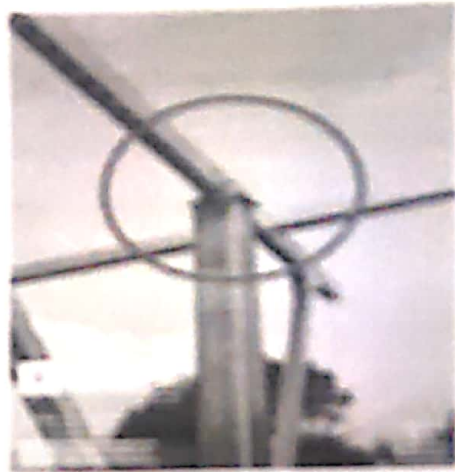
鋼鐵工架中，旋轉瓦