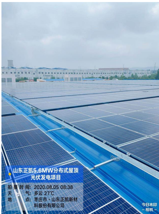
● 山东正凯5.6MW分布式屋顶 光伏发电项目 拍摄时间: 2020.08.05 08:38 天气: 多云 27℃ 地点: 枣庄市·山东正凯新材 料股份有限公司