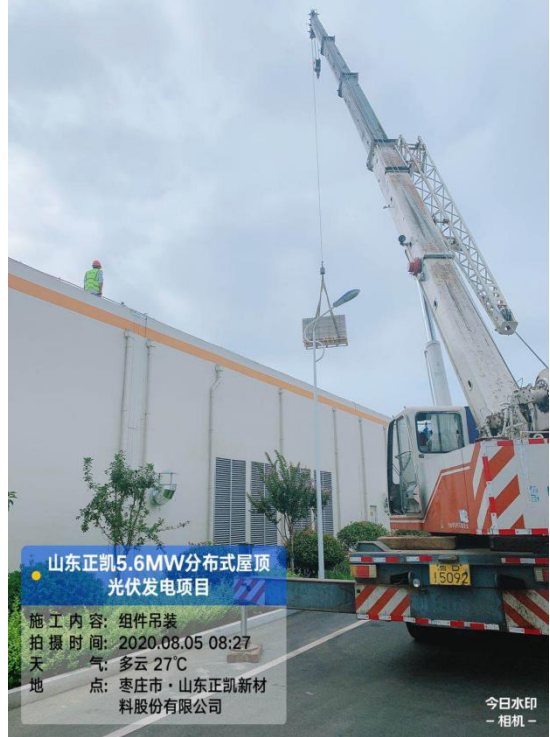
● 山东正凯5.6MW分布式屋顶 光伏发电项目 施工内容: 组件吊装 拍摄时间: 2020.08.05 08:27 天气: 多云 27℃ 地点: 枣庄市·山东正凯新材 料股份有限公司