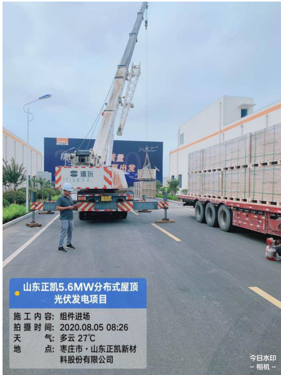
● 山东正凯5.6MW分布式屋顶 光伏发电项目 施工内容: 组件进场 拍摄时间: 2020.08.05 08:26 天气: 多云 27℃ 地点: 枣庄市·山东正凯新材 料股份有限公司