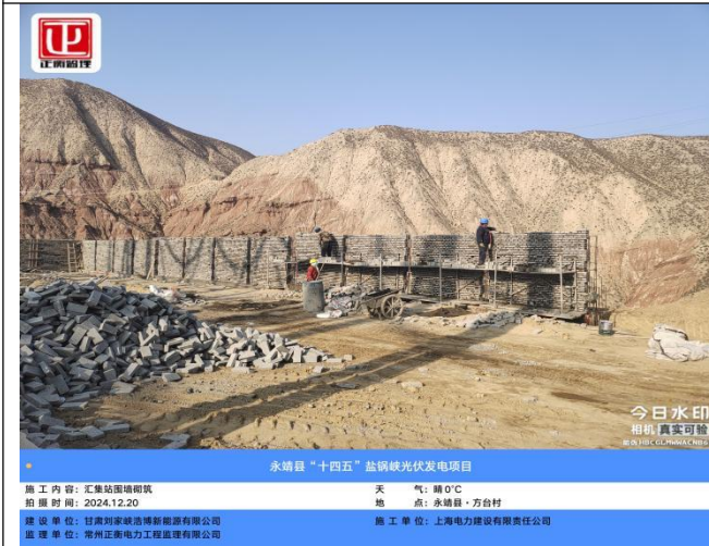
永靖县“十四五”盐锅峡光伏发电项目

施工内容: 汇集站围墙砌筑 天气: 晴 0°C 拍摄时间: 2024.12.20 地点: 永靖县·方台村