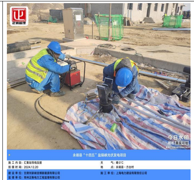
永靖县“十四五”盐锅峡光伏发电项目

建设单位: 甘肃刘家峡清洁能源开发有限公司 监理单位: 常州正泰电力工程监理有限公司 施工单位: 上海电力建设有限责任公司