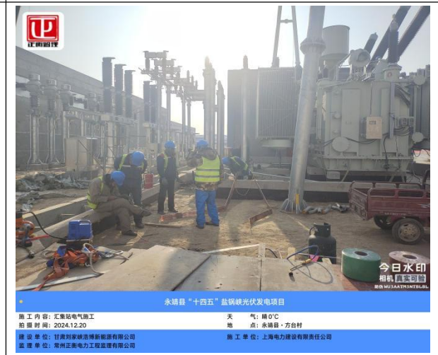
永靖县“十四五”盐锅峡光伏发电项目

建设单位: 甘肃刘家峡清洁能源开发有限公司 监理单位: 常州正泰电力工程监理有限公司 施工单位: 上海电力建设有限责任公司