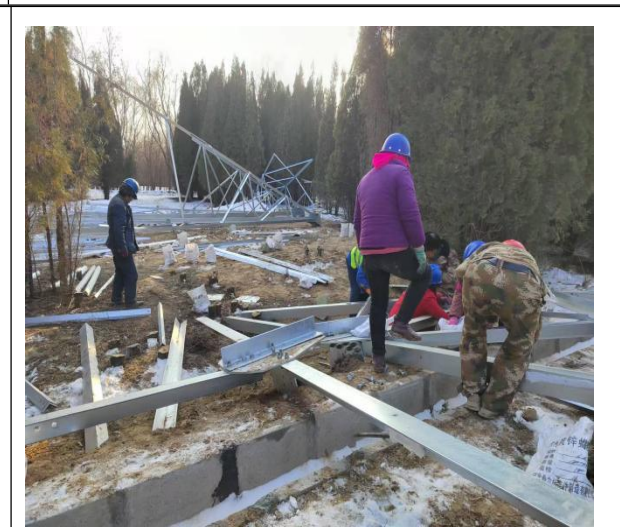
永靖县“十四五”盐锅峡光伏发电项目

施工区域: A33 施工内容: 支架安装 拍摄时间: 2024.12.20 15:53