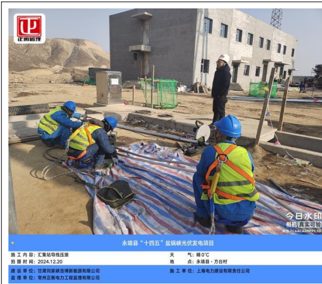
永靖县“十四五”盐锅峡光伏发电项目

施工内容: 汇集站导线压接 天气: 晴 0°C 拍摄时间: 2024.12.20 地点: 永靖县·方台村