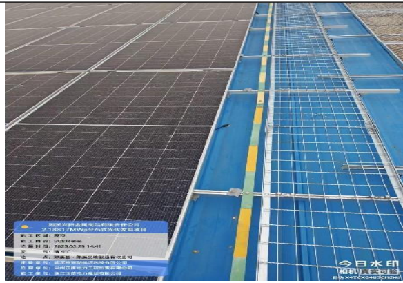
边压块存在漏装情况