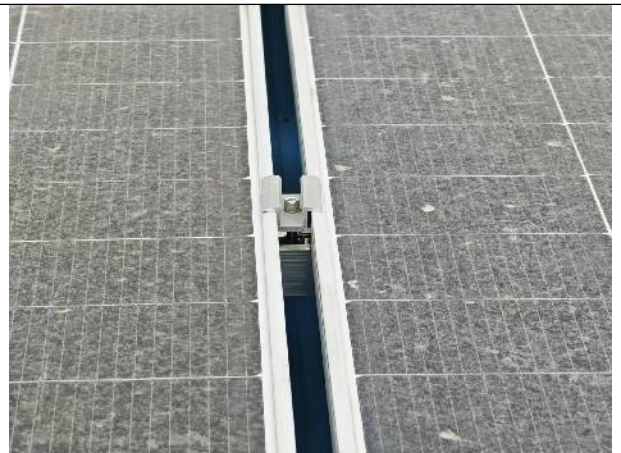
中压块安装完成后存在较大缝隙