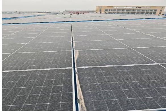
组件安装缺少导水夹