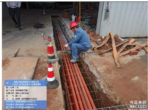
电缆沟电缆井钢筋绑扎