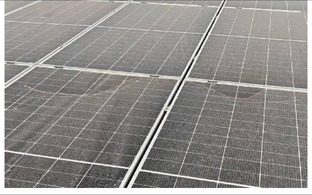
组件安装完成后未及时清理定位线