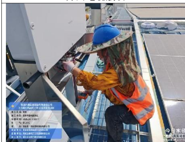
组串开路电压测试