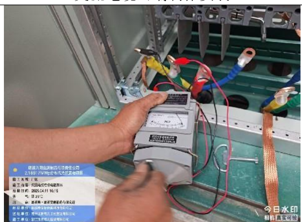
交流电缆绝缘电阻及相序测试