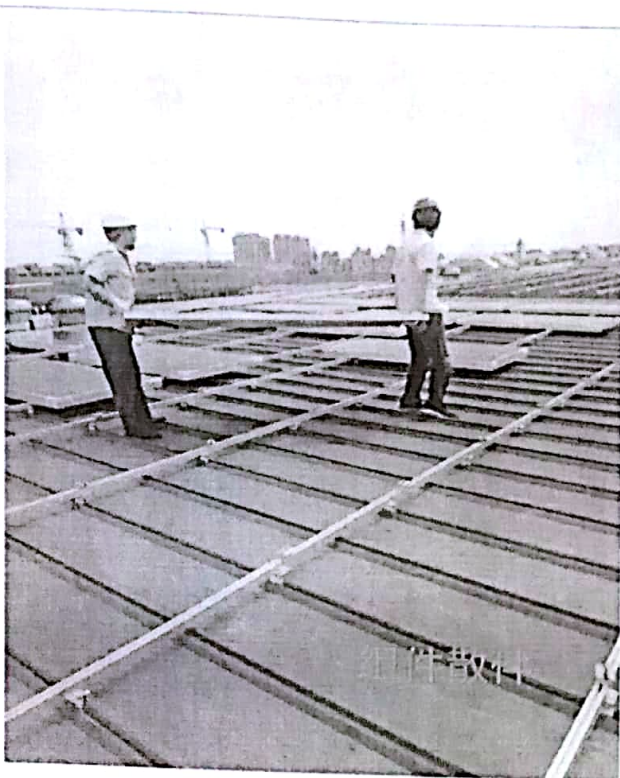
严格两人抬搭散件