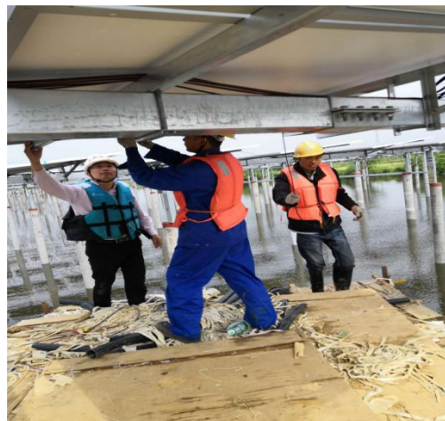
对光伏区施工进行巡视检查