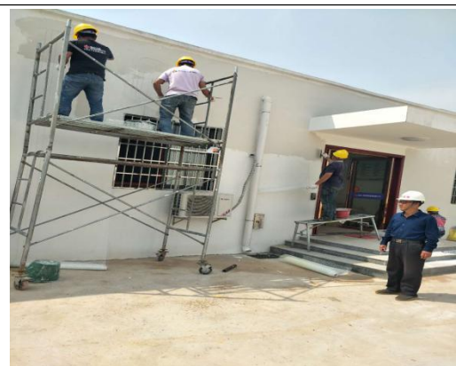
开关站综合楼外墙消缺