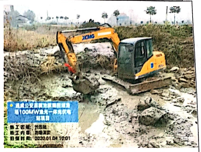
通威公安县藕池镇藕池湖渔场100MW渔光一体光伏电站项目 施工区域: 升压站 施工内容: 场地清理 拍摄时间: 2020.01.04 10:01