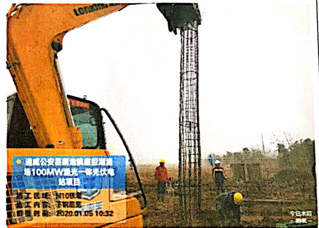
通威公安县藕池镇藕池湖渔场100MW渔光一体光伏电站项目 施工区域: N10场区 施工内容: 下钢筋笼 拍摄时间: 2020.01.05 10:32