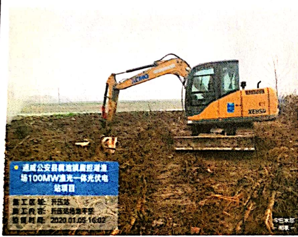
通威公安县藕池镇藕池湖渔场100MW渔光一体光伏电站项目 施工区域: 升压站 施工内容: 拆场及场地平整 拍摄时间: 2020.01.05 16:02