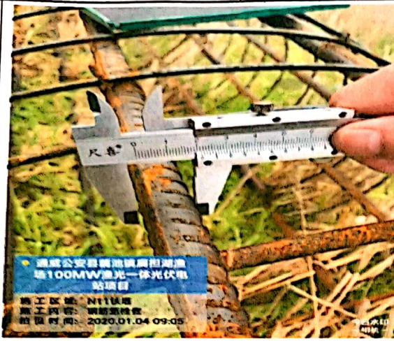
通威公安县藕池镇藕池湖渔场100MW渔光一体光伏电站项目 施工区域: N11场区 施工内容: 钢筋进场检查 拍摄时间: 2020.01.04 09:05