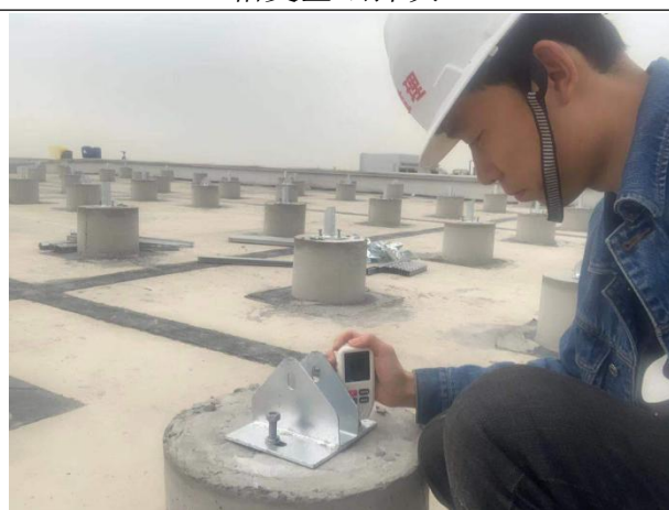
检查支架材料厚度